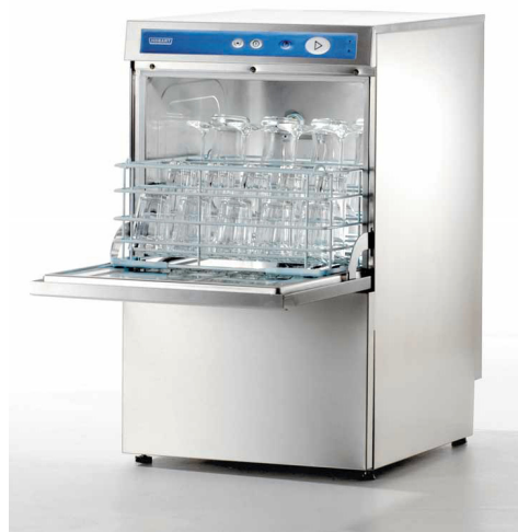
GC 41 - glasdiskmaskin