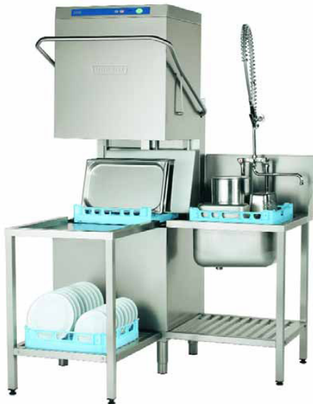
AUXXL - huvdiskmaskin för fin- och grovdisk